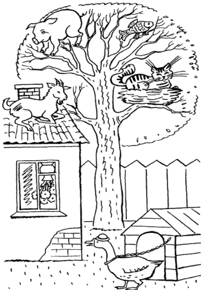
Картинка к тесту «Нелепицы».

«Внимательно посмотри на эту картинку и скажи, все ли здесь находится на своем месте и правильно нарисовано. Если что-нибудь тебе покажется не так, не на месте или неправильно нарисовано, то укажи на это и объясни, почему это не так. Далее ты должен будешь сказать, как на самом деле должно быть».